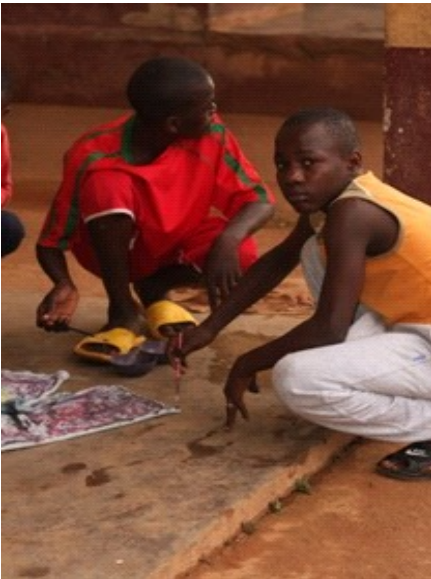
Jóvenes del centro