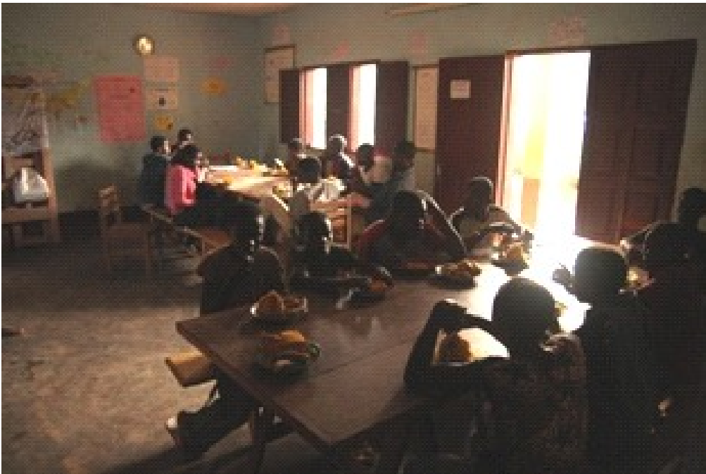
Comedor y sala de estudio